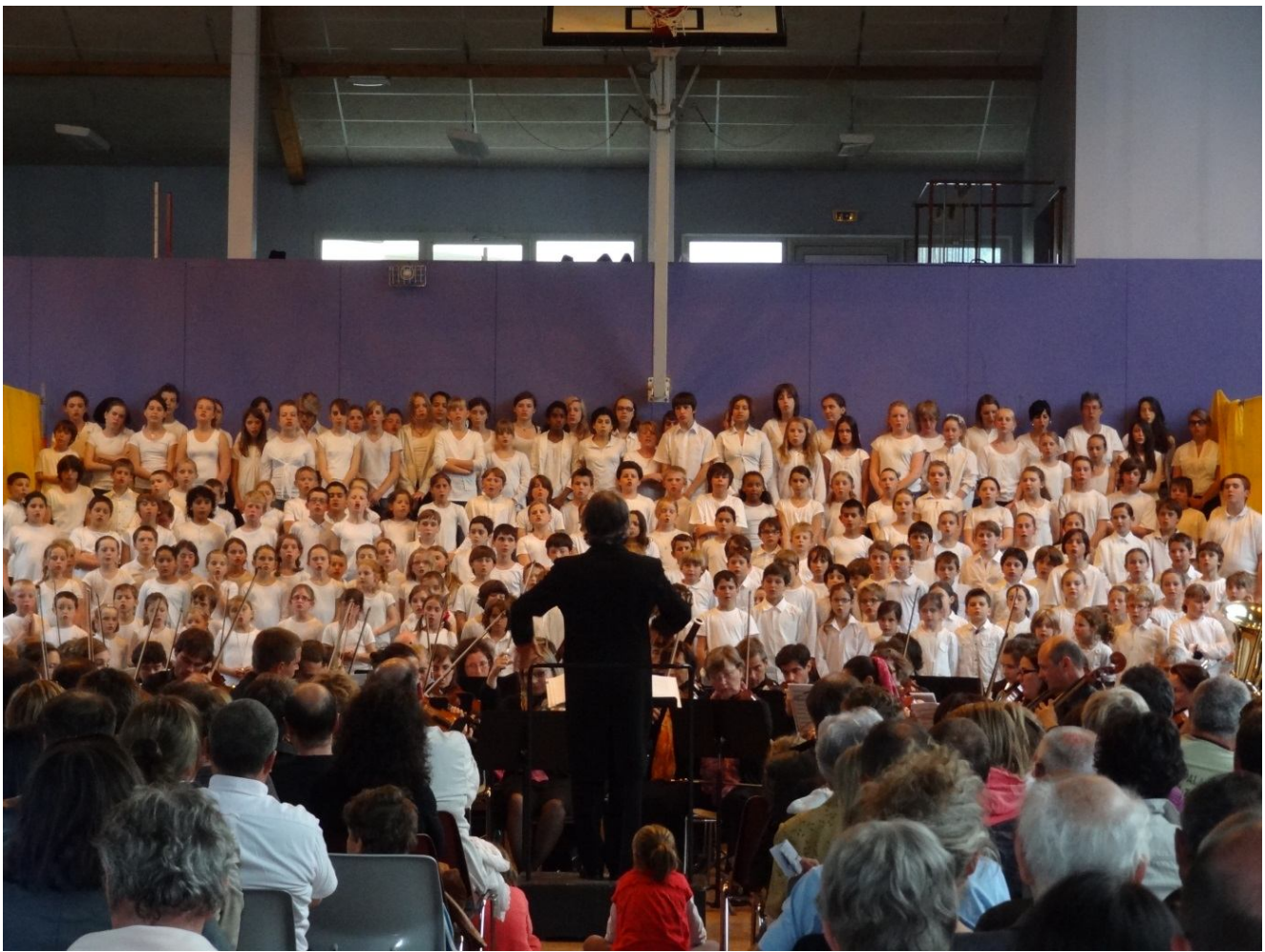
Concert avec les élèves de cycle 3 de Morzine, Saint Jean d'Aulps, Essert Romand, Le Biot et les collégiens de Saint Jean d'Aulps et Saint Julien en Genevois