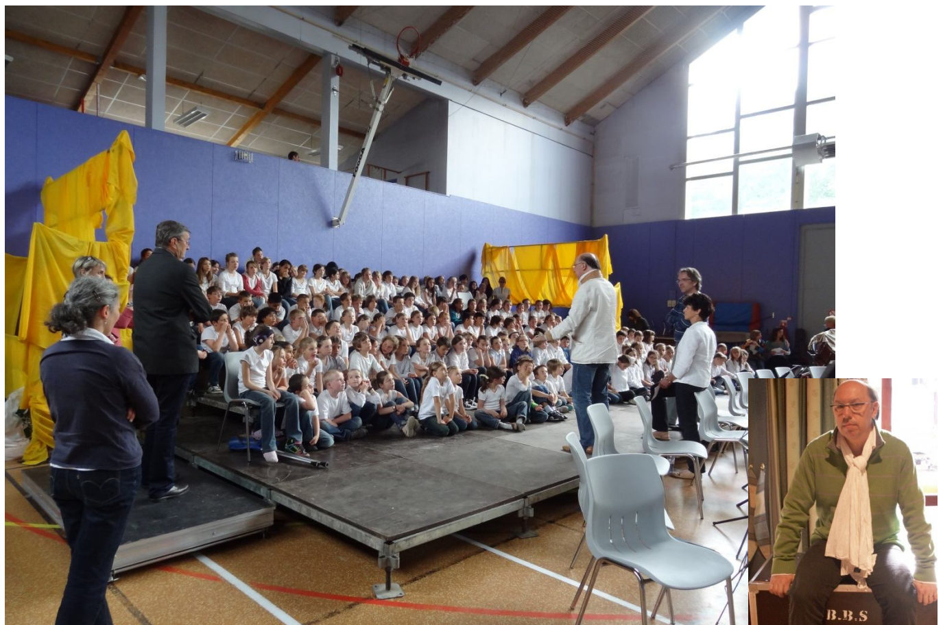
Rencontre avec le compositeur avant le concert